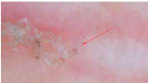
Midegang og mide i dermatoskop